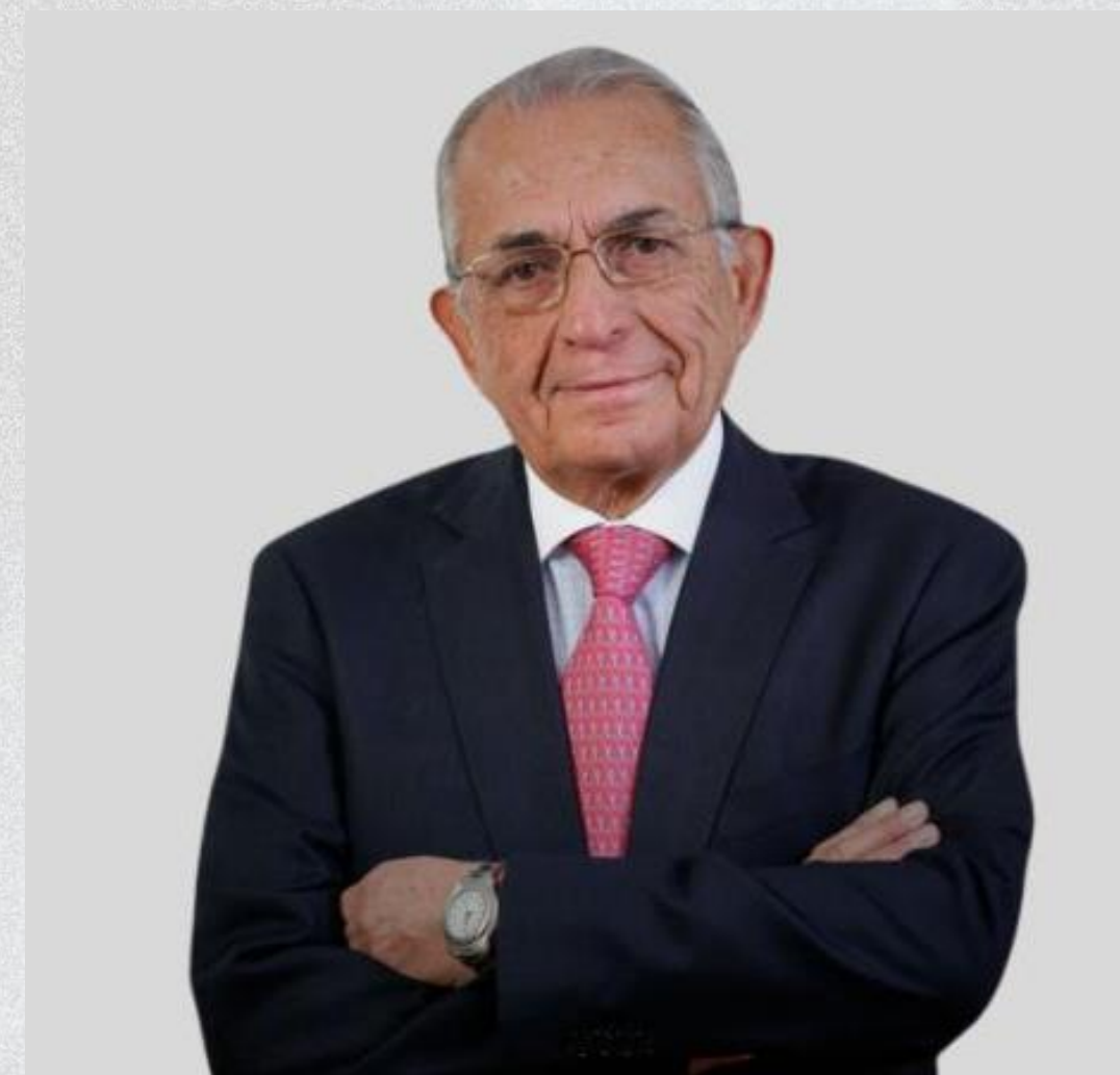
Carlos Cáceres, economista, académico, empresario y político 29 de septiembre