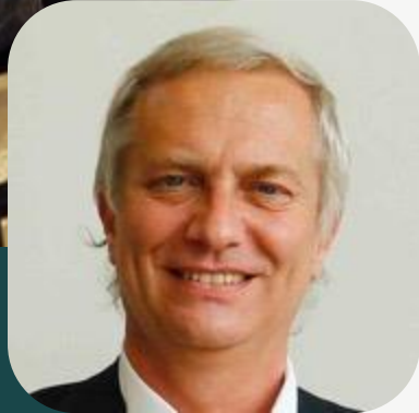
José Antonio Kast Marzo