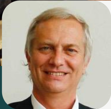
José Antonio Kast Marzo